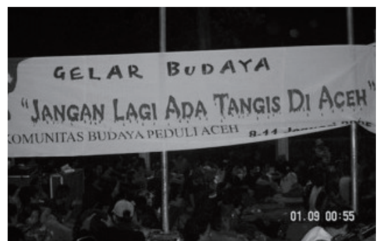
1月9日にマリオボロで行われたチャリティーコンサート

街角では“Doa untuk Aceh”（アチェのために祈ろう）とかかれたステッカーを貼ったバイクを見かけますし、大学生などが実際に現地へ赴いて救援活動も行っているようです。一般市民（ジャワ人）にとって、アチェの人々は同じ国に属する兄弟なのだから、助けて当然という考えが当然のようにあると感じました。